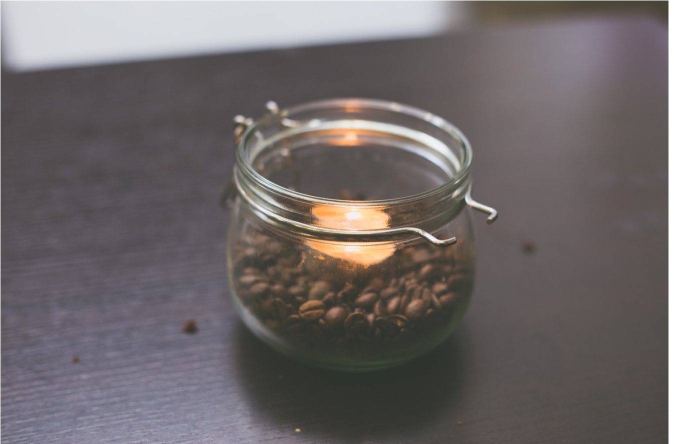
Kuva otettu ViaDia Järvenpää ry:stä

Suomen Vapaakirkon ja ViaDia ry:n EU-ruoka-aputyön ohjeistus ja Vähävaraisten avun toimenpideohjelmaan 2018