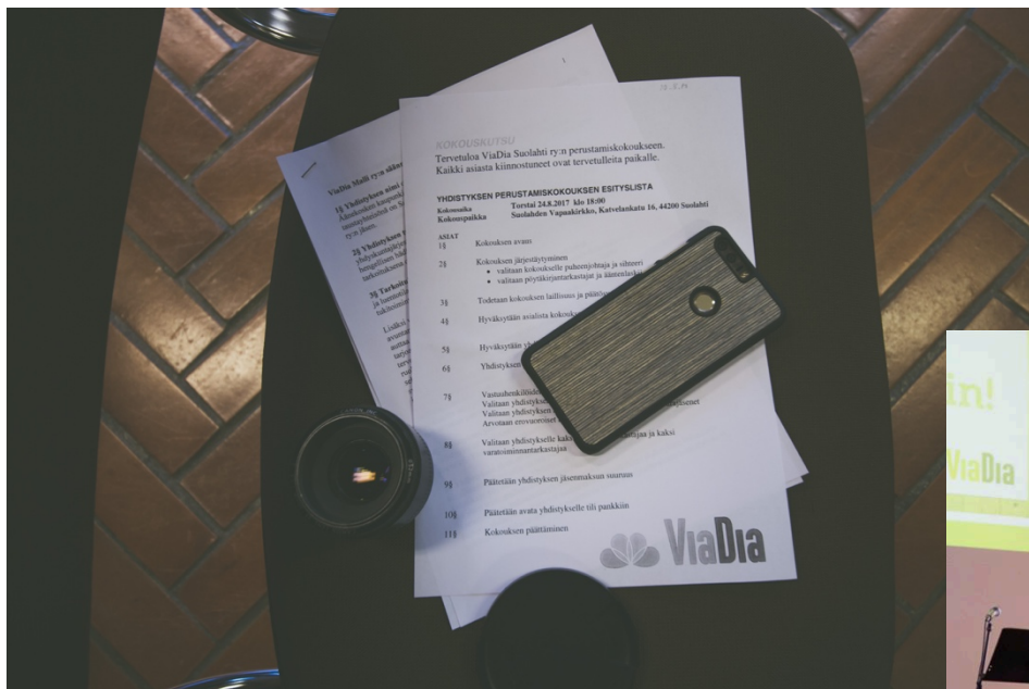
ViaDia Suolahti ry perustamispäivä

Lomakkeessa on erillinen rivi aterioihin käytetyistä tuotteista. Huom! Tätä kirjanpitoa ei toimiteta eteenpäin, vaan se jää seurakuntaan. Sitä on säilytettävä 6 vuotta.