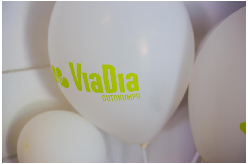
ViaDia Outokumpu ry liittyi ViaDia:n joukkoon 2017